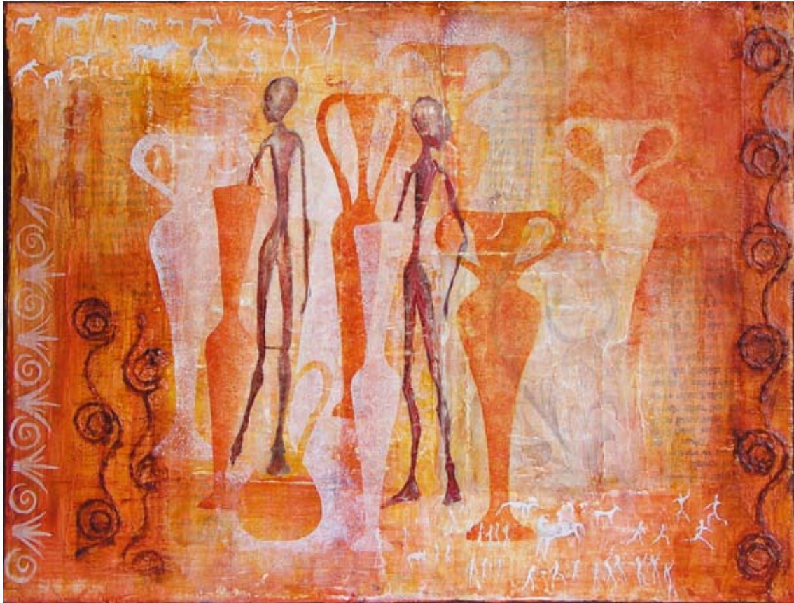
“Veda” 30 x 40 cm

I det færdige maleri anes collagen i baggrunden gennem flere transparente farvelag. Visse steder er motiverne malet op igen i en anden farve end den oprindelige.