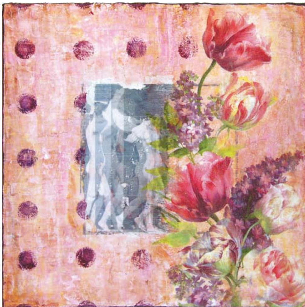
“Kvinde i Bevægelse”

Som det allersidste er overføringsbilledet lagt på.