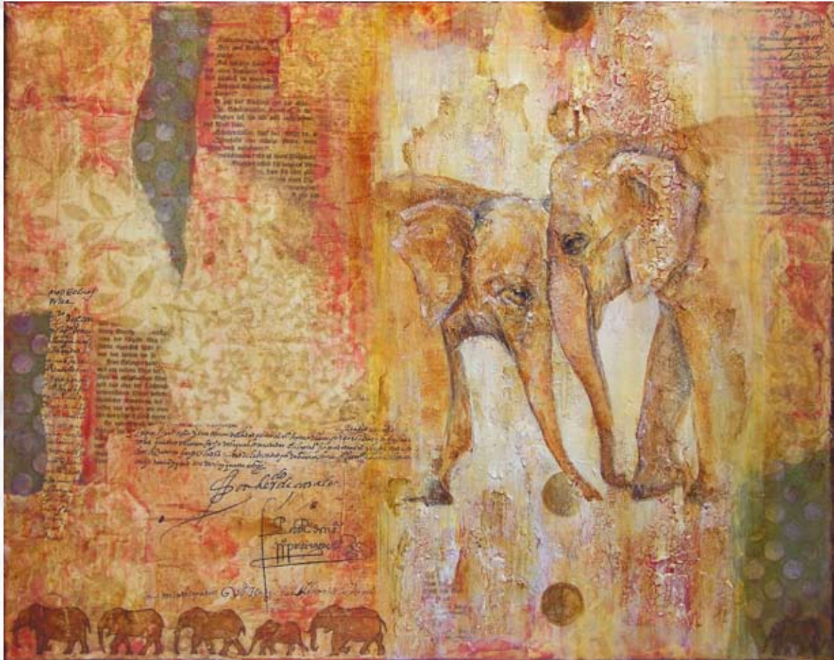
“Møde under Månen”