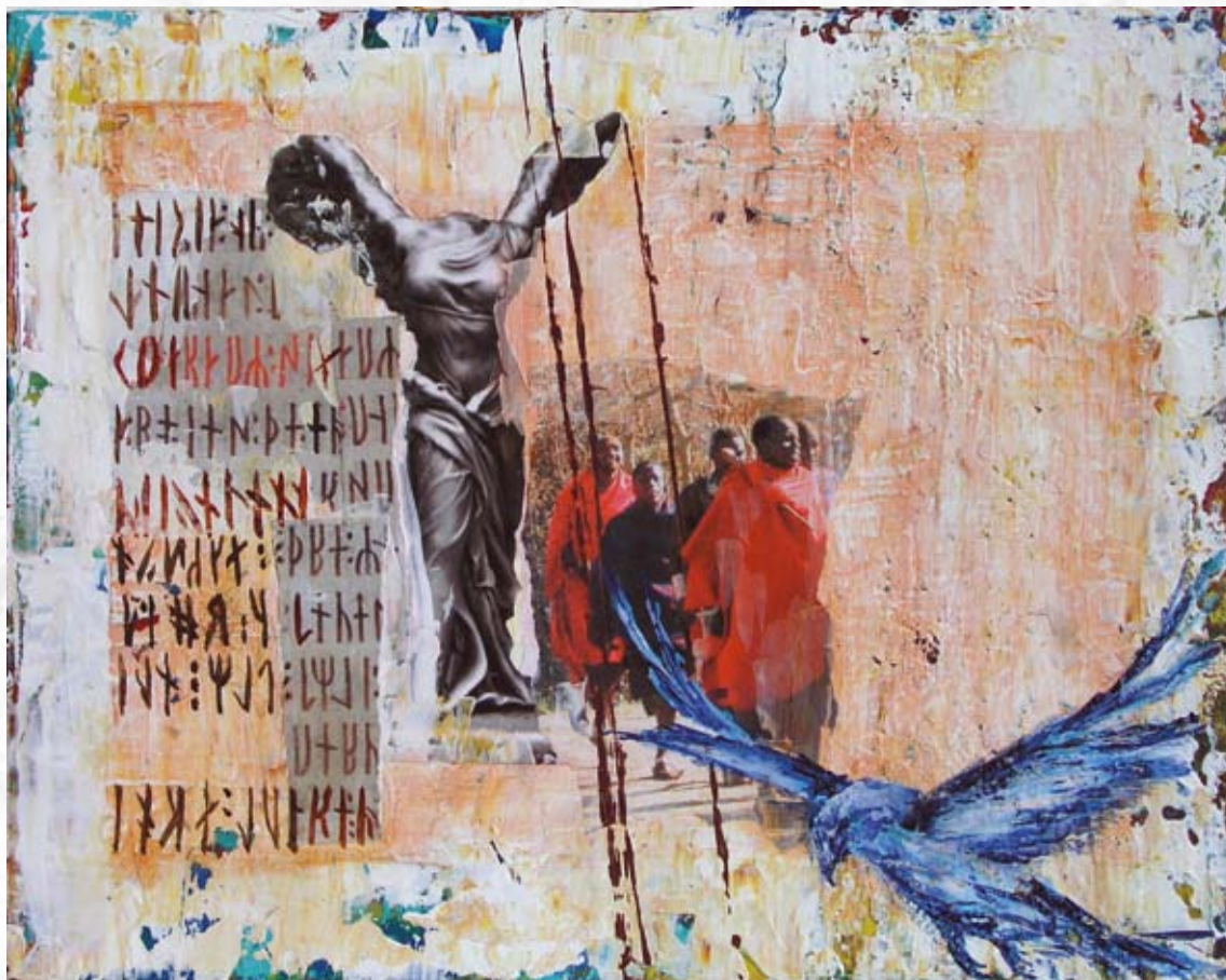
“Komplementaritet I” 24 x 30 cm.

I det færdige maleri er nogle af runerne malet op igen med en tynd pensel (se afsnittet om skrift).