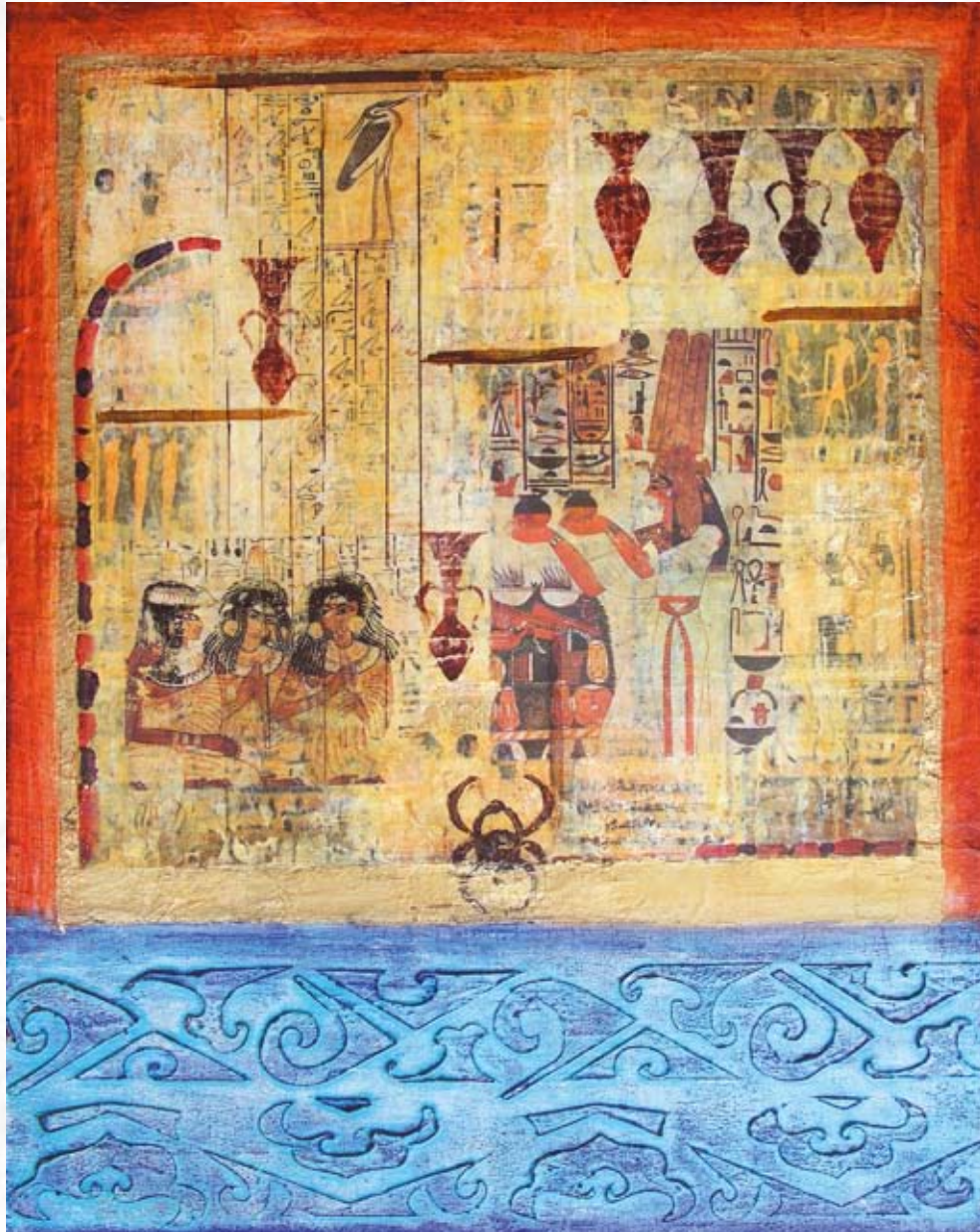
“Solens Rige I”