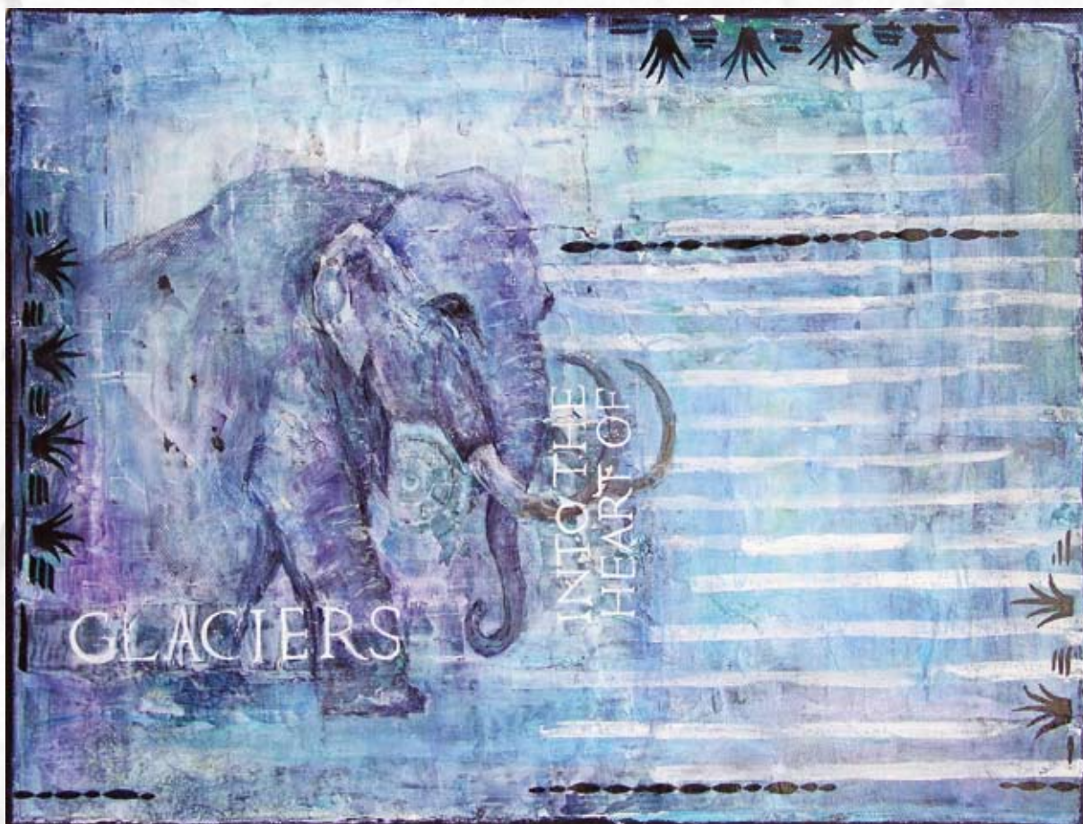
“I Gletcherens Hjerter”